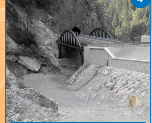
Strada per Passo Pramollo