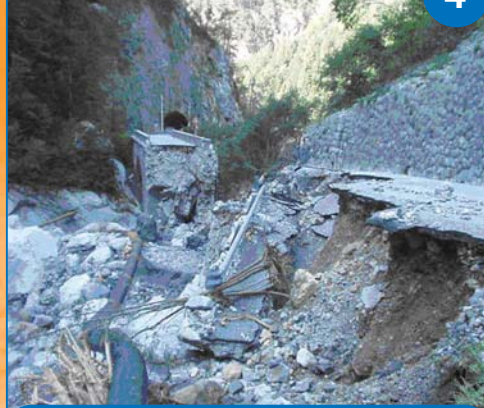
Strada per Passo Pramollo